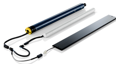
Somfy Oximo Wirefree